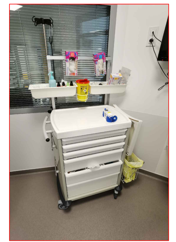
Chariot de soins