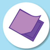
Emballages de matériel

Ces déchets sont éliminés par la filière des déchets ménagers non recyclables de votre domicile.