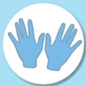
Matériels de protection (tablier, gants, masque...)