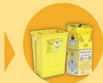
Caisse ou Fût jaune