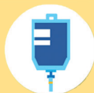
Poches et tubulures