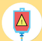
infuseurs, déchets cytotoxiques vides