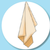
Déchets issus du nettoyage