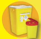
Caisse ou conteneur à aiguilles

Si votre prise en charge nécessite ce type de matériel, l'HAD fait installer un container à déchets à votre domicile par un prestataire.