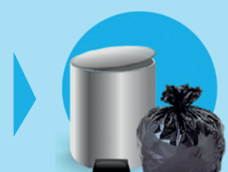
Poubelle à ordures ménagères