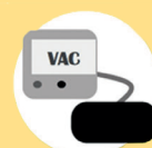
Pansement à pression négative